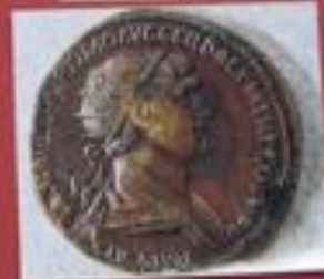
Dupondius (11,40 gr.)