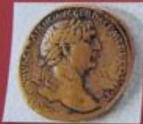
Messing: Sesterz (2,7, 52 gr.)