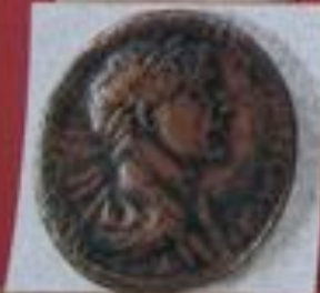
Kupfer: As (12,25 gr.)