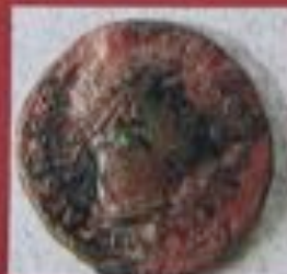
Semis (4,23 gr.)