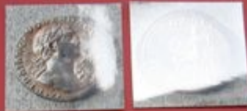
Silber: Denar (1,97 gr.)