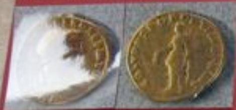
Gold: Aureus (7,23 gr.)